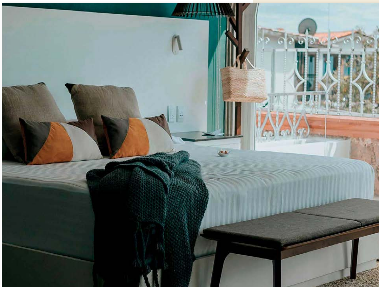
DE CANTERA Y PLATA Hotel Boutique Taxco, Guerrero.