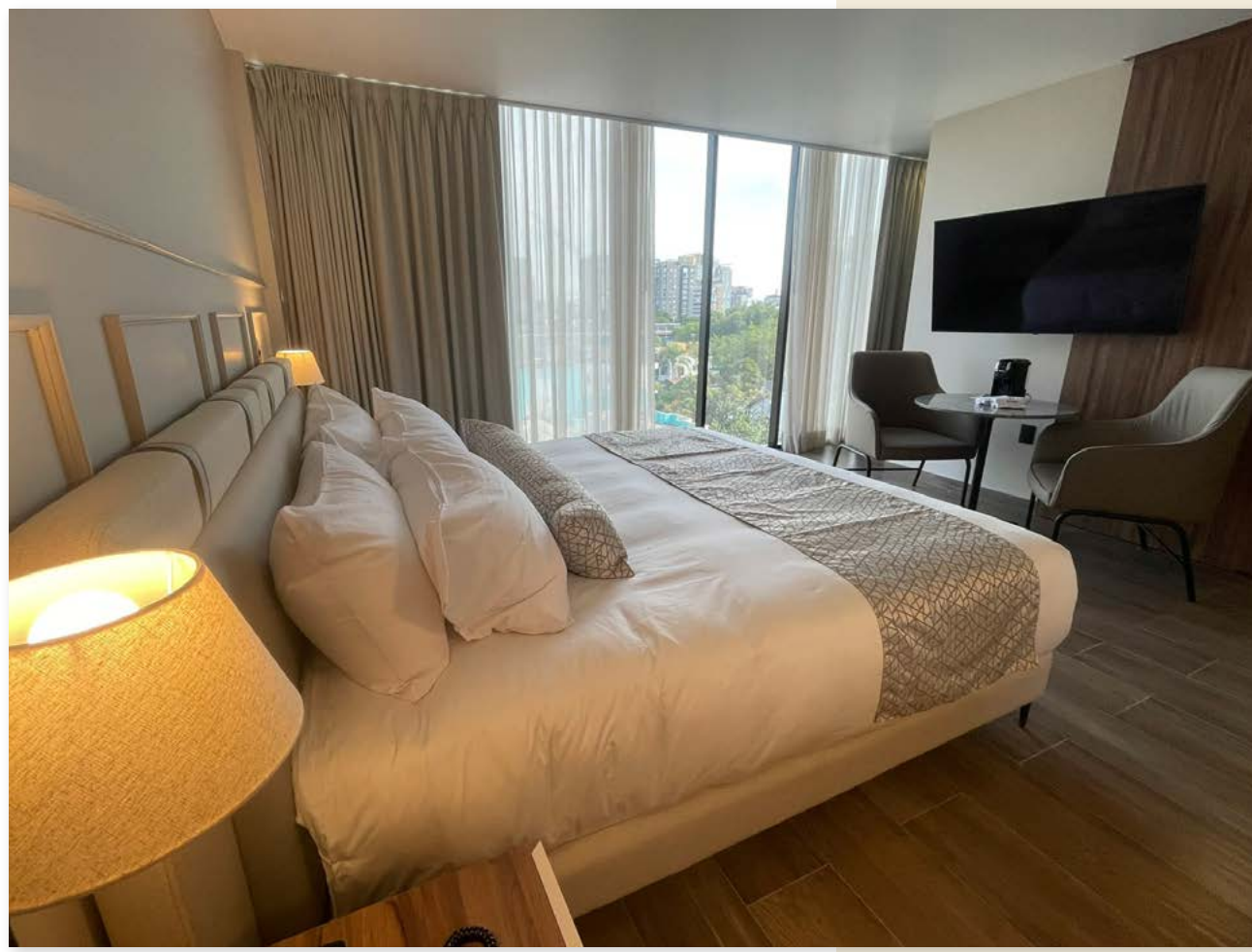
OTMÁNN Hotel Boutique Guadalajara, Jalisco