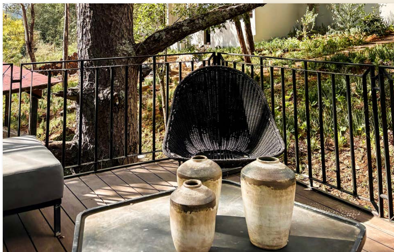
SERENZZO Hotel & Cuisine Tapalpa, Jalisco