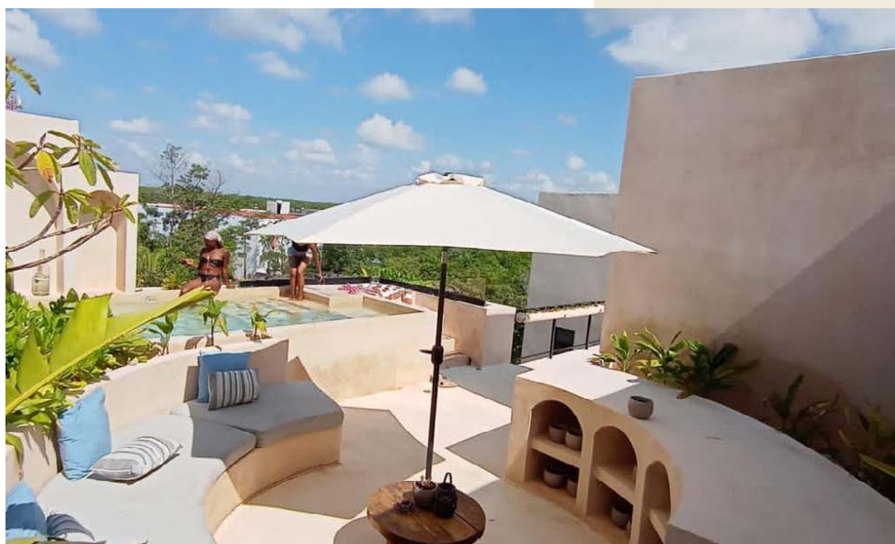
ETERNA Tulum, Quintana Roo